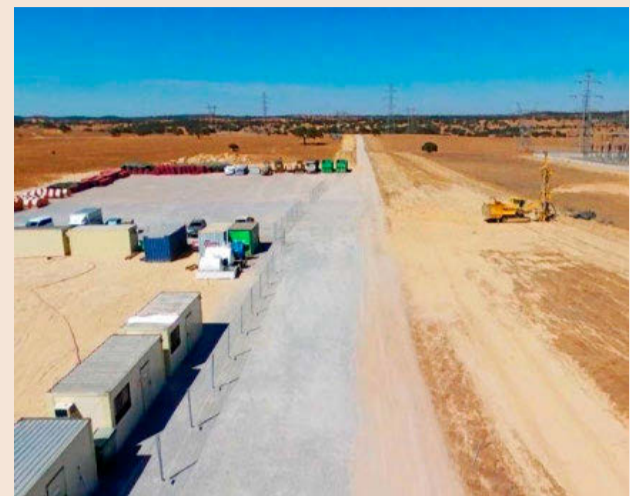
Una imagen de las obras en el concejo luso de Ouceijo.

En los años setenta empezó a dar servicio en otras localidades y con el tiempo fue ampliando actividad a otros servicios: en los ochenta con la recogida selectiva y en los noventa con parques y jardines y tratamiento de aguas.