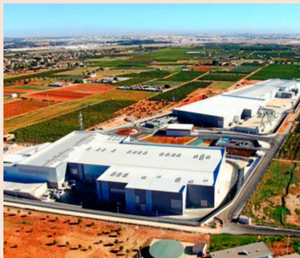
Instalación de tratamiento de residuos en Manises (Valencia).