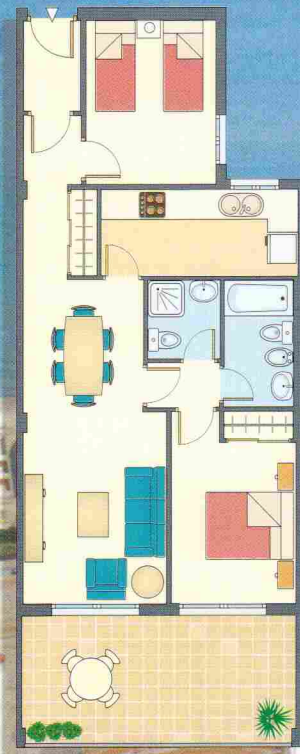
VIVIENDA TIPO A